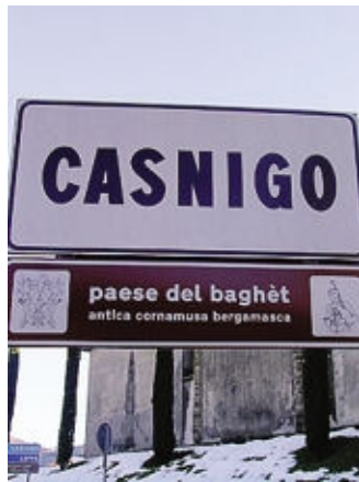
A Casnigo una giornata sulla cultura del baghèt

Ore 9,30-12,30, alla Ca' Parecia, via Foscolo, «Cibo è... il giorno del raccolto» per riscoprire il piacere di una giornata nella natura raccogliendo le pannocchie di mai spinato; dalle ore 12,30, «Dal campo alla tavola» tipico pranzo bergamasco; ore 16,30-18, in piazza Vittorio Veneto, scartocciatura delle pannocchie, merenda, concerto degli «Aghi di Pino» e premiazione del concorso per le scuole secondarie «Cibo è... 140 caratteri e un clic» e per le scuole primarie «Cibo è... 140 caratteri e un disegno». Ore 18, sala consiliare, «Cibo è... Expo 2015 e le realtà locali» conferenza a cura dei Consiglieri regionali lombardi; dalle ore 20,30, al chiostro di S. Maria at Ruviales, via XX Settembre, «Cibo