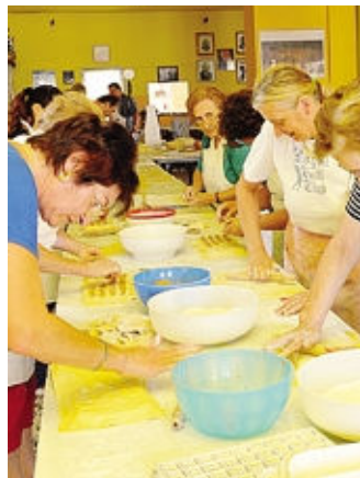
A Covo va in scena la sagra del raviolo nostrano

Continuano i festeggiamenti per il 40° anniversario di fondazione della sezione locale dell'Associazione Arma Aeronautica. Ore 15-19, all'oratorio