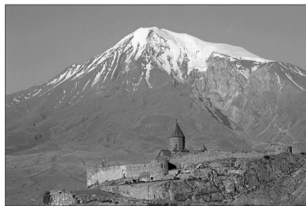
Foto di un viaggio in Armenia